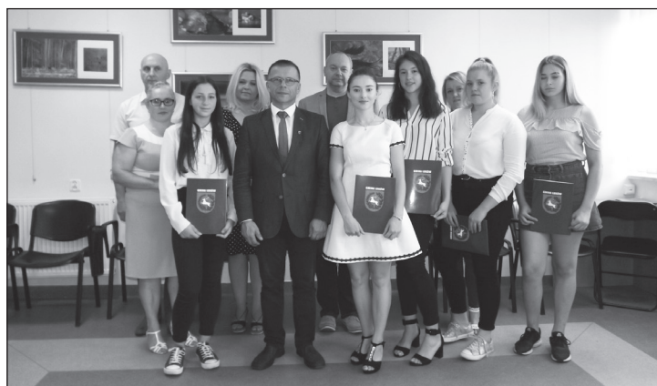
Stypendyści z opiekunami