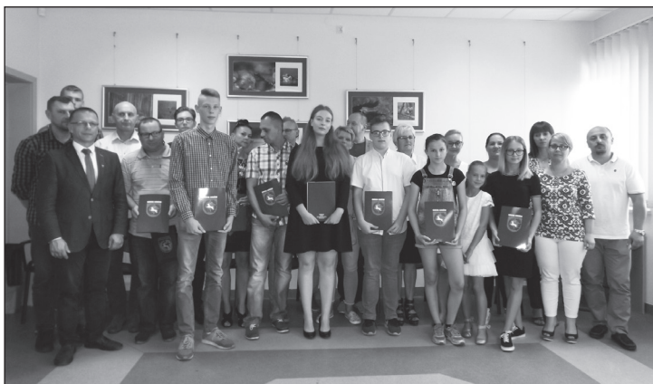
Nagrodzeni z opiekunami