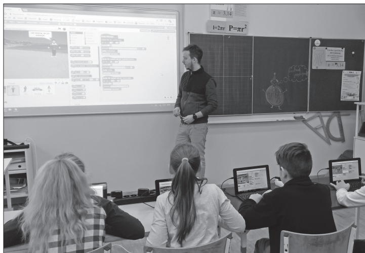
fol. ZS Krynka

Wnioski o dofinansowanie przygotowano w Gminnym Zespole Oświatowym w Łukowie.