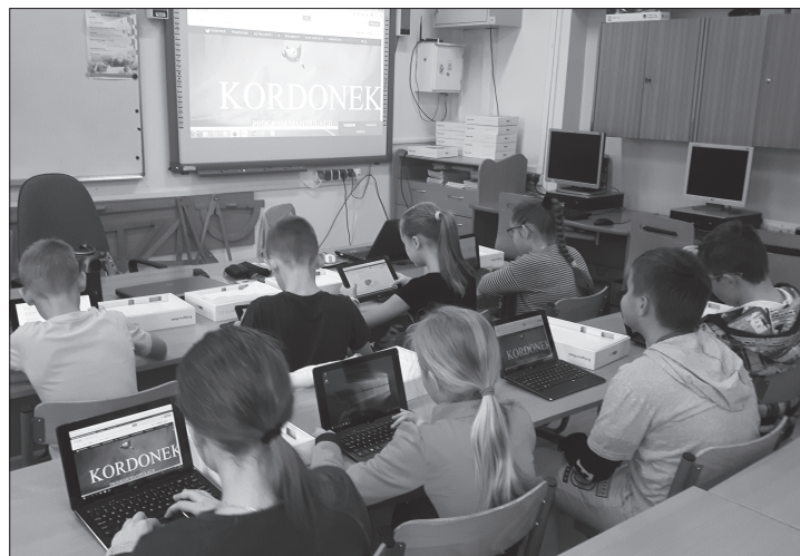
fol. A Śledź