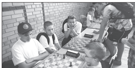
Zawodnicy KSz Hetman Krynka na festiwalu szachowym w Suwałkach

Klub szachowy Hetman Krynka powstał w 2014r. Wcześniej działalność szachistów była niesformalizowana. Członkowie Klubu wielokrotnie angażowali się w organizację imprez szachowych na terenie gminy Łuków oraz uczestniczyli w turniejach szachowych o szerokim zasięgu. Organizacja tych zawodów była realizowana we współpracy z organami administracji publicznej – szkołami, gminą Łuków, ośrodkami kultury, miejscową parafią. W niedzielne popołudnia w sali katechetycznej przy parafii św. Jana Chrzyciela w Kryncie członkowie Klubu regularnie organizują szkolenia szachowe dla dzieci i młodzieży.