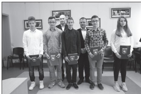
Stypendyści Gminy Łuków