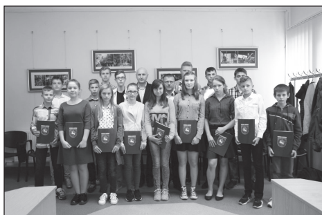
Laureaci Nagrody Wójta Gminy Łuków

W dniu 21 września w sali konferencyjnej Urzędu Gminy Łuków odbyło się uroczyste wręczenie Stypendiów Gminy Łuków oraz Nagród Wójta Gminy Łuków w ramach gminnego programu stypendialnego.