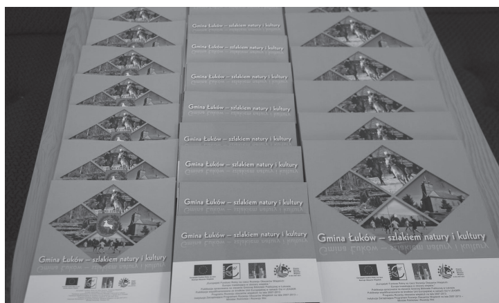
Fot. UG Łuków

Publikacje zostały przygotowane w ramach projektu pn. „Przygotowanie i wydanie publikacji informacyjno – promocyjnych dotyczących Gminy Łuków”, współfinansowanego z Programu Rozwoju Obszarów Wiejskich na lata 2007 – 2013, działanie 413 Wdrażanie lokalnych strategii rozwoju dla małych projektów.