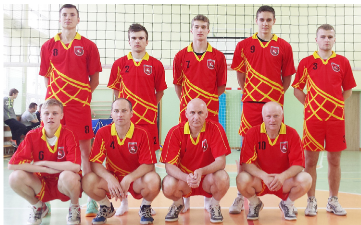
Drużyna Gminy Łuków II